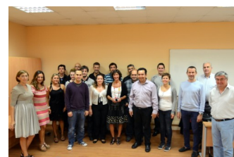
"Participantes Programa "Santander Avanza"