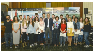
Becarios del Proyecto Europeo " Trenti VII"