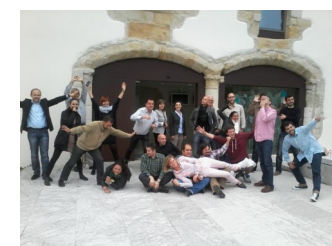
Santander Team Street