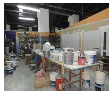
Aula de prácticas del curso de Pintor